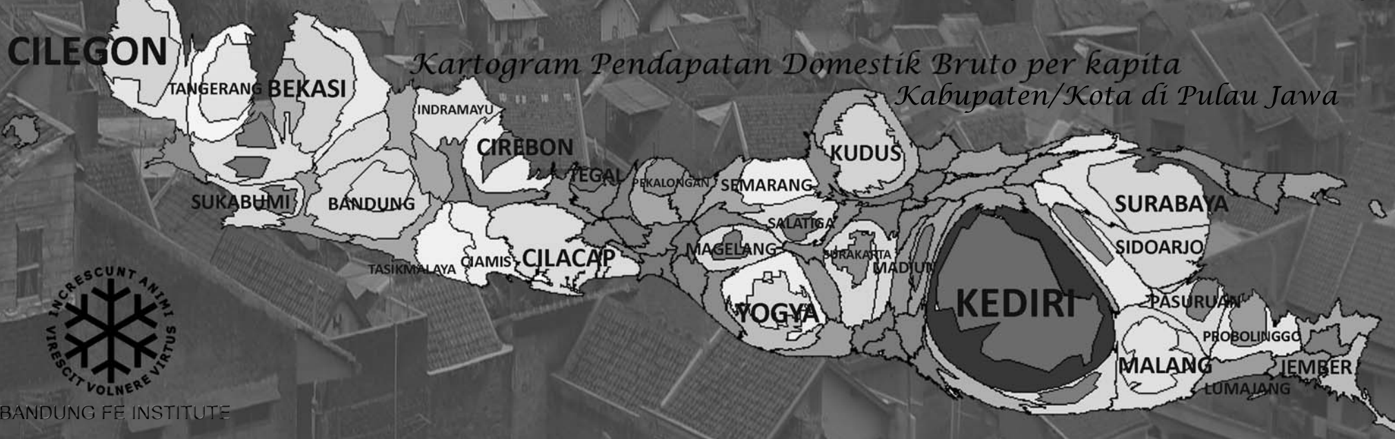
Kartogram Pendapatan Domestik Bruto per kapita Kabupaten/Kota di Pulau Jawa